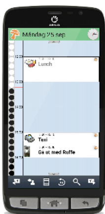
Kalendervyn med tidpelare

Du kan koppla en checklista till dina aktiviteter, till exempel vad du ska ta med till skolan eller träningen så att du kan vara säker på att du inte glömt något. Du kan också göra dina aktiviteter kvitterbara, vilket dels blir ett minnesstöd för dig, men även en trygghet för både dig och dina anhöriga då ni kan se om aktiviteten genomfördes, till exempel om du tagit din medicin.